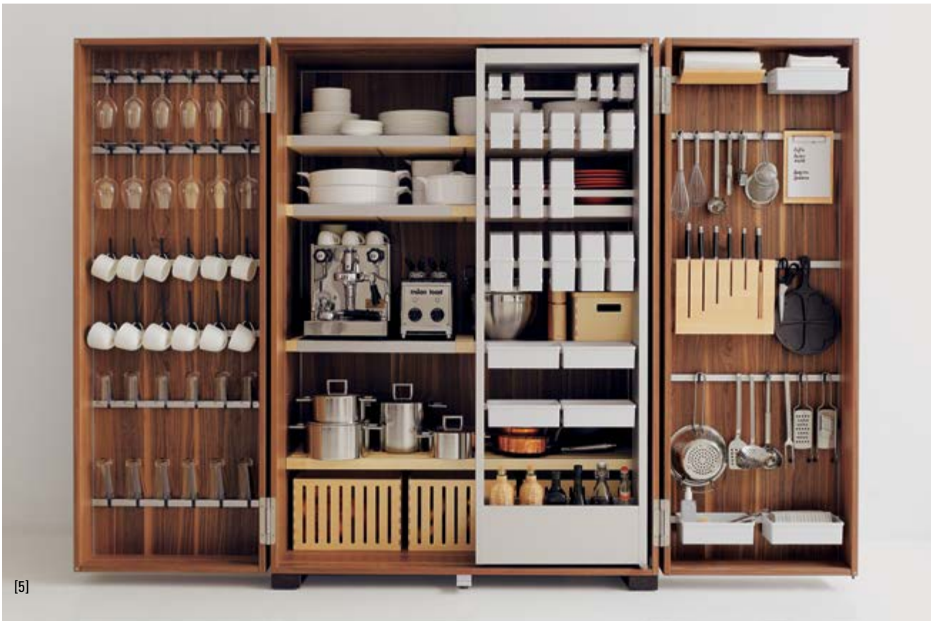
De Bulthaupt b2, in uitvoering [1]