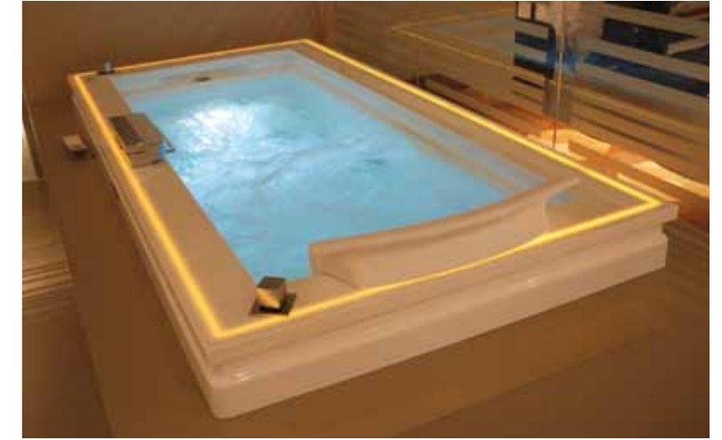
Carlo Urbinati [1]