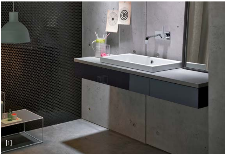
Betty Blue [2]