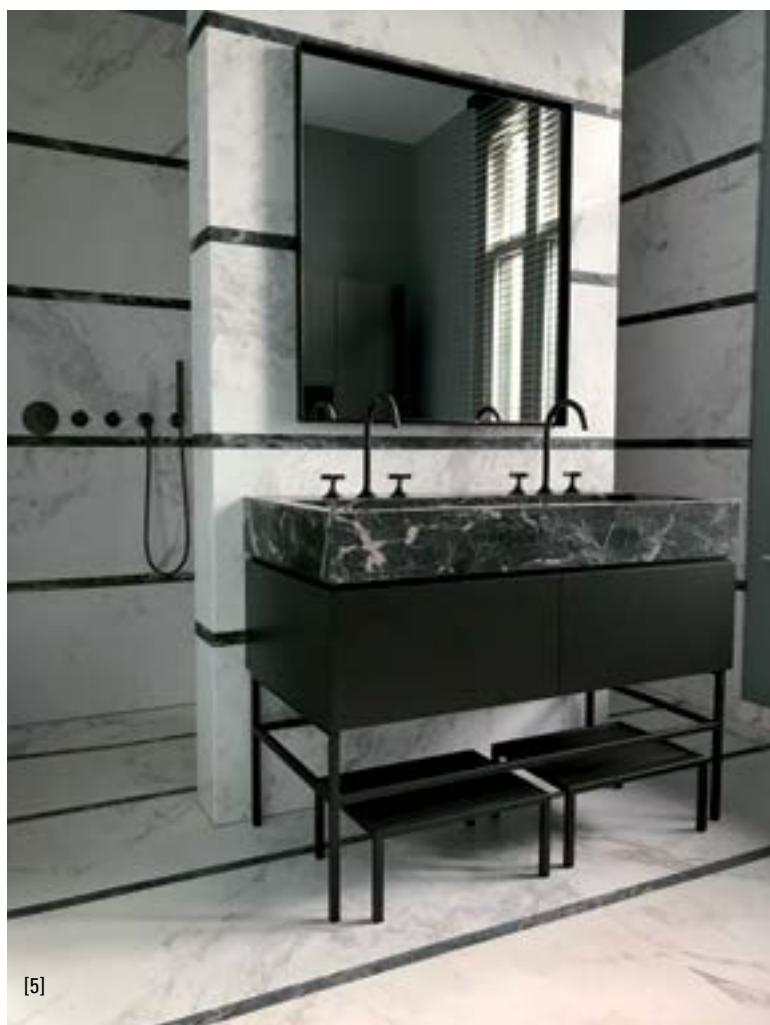
Interieurs van Lex de Gooijer ...inspiratie uit natuursteen... [1 - 5]

Het begin was spannend. Zoals bij iedere startende ondernemer gaf het af en toe een onzeker gevoel, maar dit verdween toen hij een opdracht kreeg van een bevriende relatie. Na een brand moest een vrijstaande villa van binnen geheel gerenoveerd worden. Lex de Gooijer kreeg het vertrouwen en de vrije hand om de woning from scratch te renoveren en in te richten. Sindsdien stapelen de aanvragen zich op.